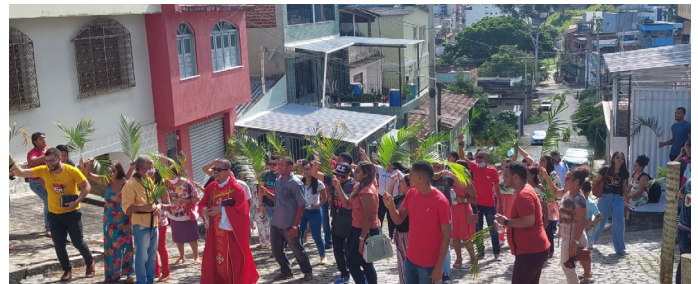
Domingo de Ramos com os jovens

Momentos fortes vivenciamos diante do Mistério da Paixão, Morte e Ressurreição de Jesus na Sexta-feira, no Sábado Santo e no Domingo. No Domingo de Páscoa realizamos a Primeira Comunhão e as crianças realizaram uma apresentação Pascal. Como apaixonistas, para cada momento vivido, fazíamos ecoar nos corações, a Sabedoria da Cruz.