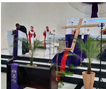
Terça-feira Santa: Celebração Penitencial