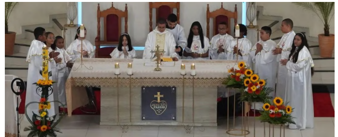
Domingo de Páscoa: primeira comunhão e apresentação Pascal das crianças

Momentos fortes vivenciamos diante do Mistério da Paixão, Morte e Ressurreição de Jesus na Sexta-feira, no Sábado Santo e no Domingo. No Domingo de Páscoa realizamos a Primeira Comunhão e as crianças realizaram uma apresentação Pascal. Como apaixonistas, para cada momento vivido, fazíamos ecoar nos corações, a Sabedoria da Cruz.