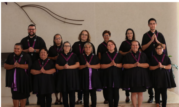
Membros da Confraria da Paixão da Paróquia Nossa Senhora Aparecida (Luziânia/GO)