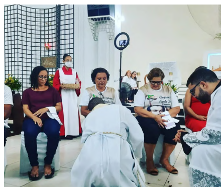
Quinta-feira Santa: Lava pés