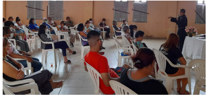
Retiro quaresmal paroquial

A Paróquia Santa Maria Goretti, de Itabuna-Ba, viveu o período quaresmal e a Semana Santa, com alegria, devoção e muita fé. No início, a fim de aprofundarmos a Palavra que nos converte, criamos a Escola Bíblica São Paulo da Cruz. Na sequência, com riqueza de espiritualidade, fazemos a experiência do Retiro quaresmal paroquial. E de olhos no Crucificado, rezamos e meditamos a Via Sacra, todas as sextas feiras, às 05hs da manhã.